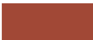
Rouge tuile 637