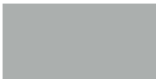
Gris lumineux 222