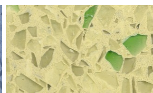
Palmier + Emeraude