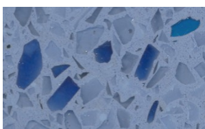
Provence + Saphir

Henry Moore Art Gallery – Leeds, UK; Planet Hollywood, Cannes, France; Karen Millen, Sweden; Euro Disney; Hanley market; BT Oswestry; Café Grand Prix, London; Sharjah Mega Mall in UAE.