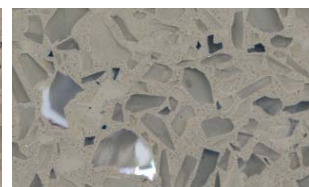
Sable + Perle

Exemples de créations en associant un choix de nuances de résine et de mélanges de granulats minéraux.