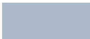
Bleu ciel 452

Les couleurs réelles peuvent être différentes de ce nuancier. Echantillons sur demande à votre représentant.