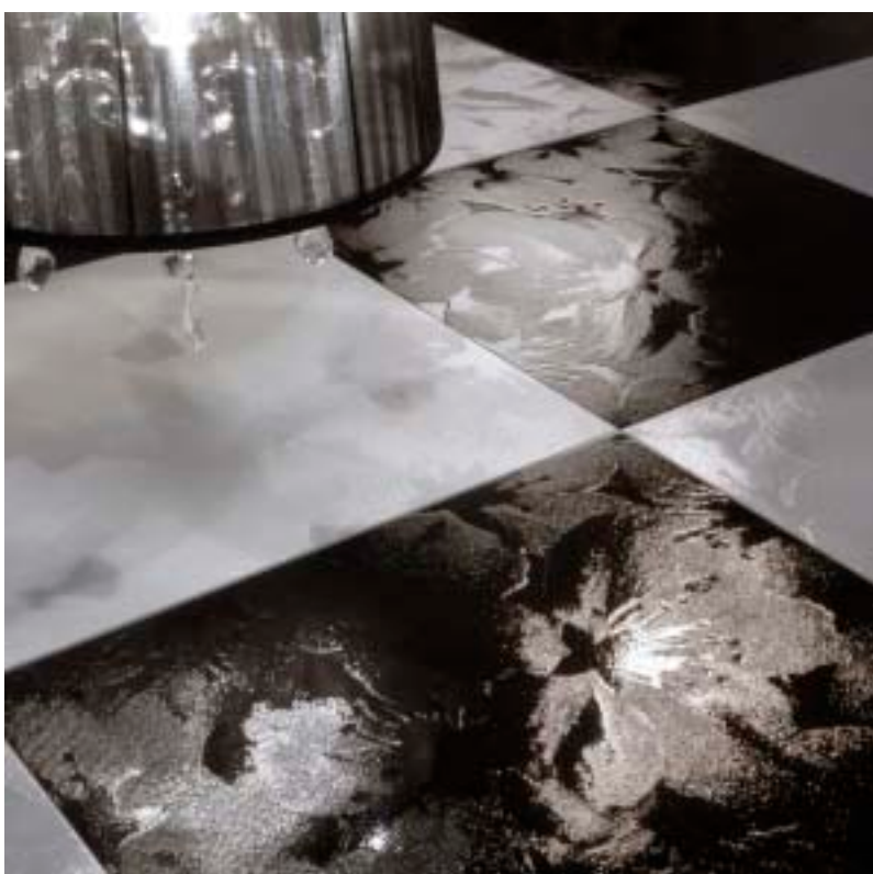
Des alternances et des jeux de lignes inédits avec les toutes récentes collections d'Inter Ceram.

La résine met la création à vos pieds en se prêtant aux projets les plus divers. C'est l'excellence pour tous ceux qui souhaitent un sol équivalant à une œuvre unique! Sans courir le risque que com-