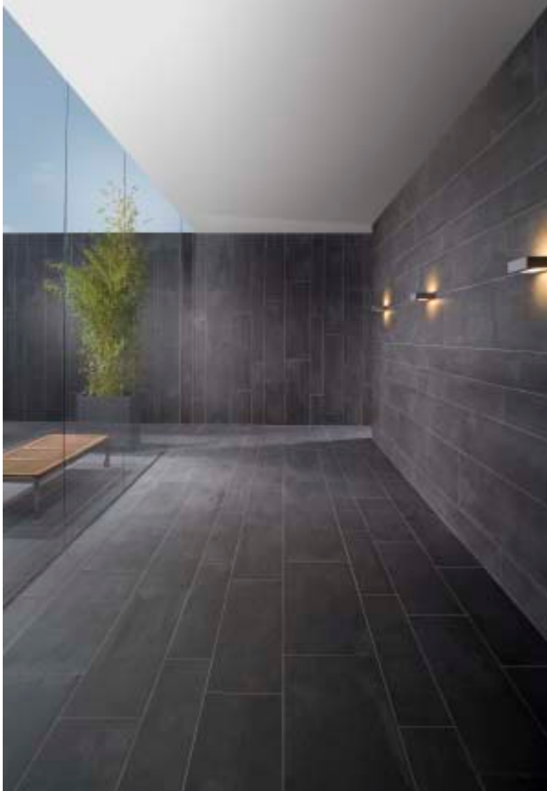
Le carreau traditionnel s'étire en des jeux de lignes architectoniques qui renouvellent totalement le classicisme de la formule : Royal Mosa.

métalliques ou organiques voire même optiques, il se laisse colorer avec une remarquable docilité et, grâce à la finesse des mortiers utilisés, il se révèle tout à fait confortable à la marche. Et l'on peut même le doter de motifs reliés étonnants. Une remarque toutefois : ce type de sol impose l'intervention d'un placeur spécialisé.