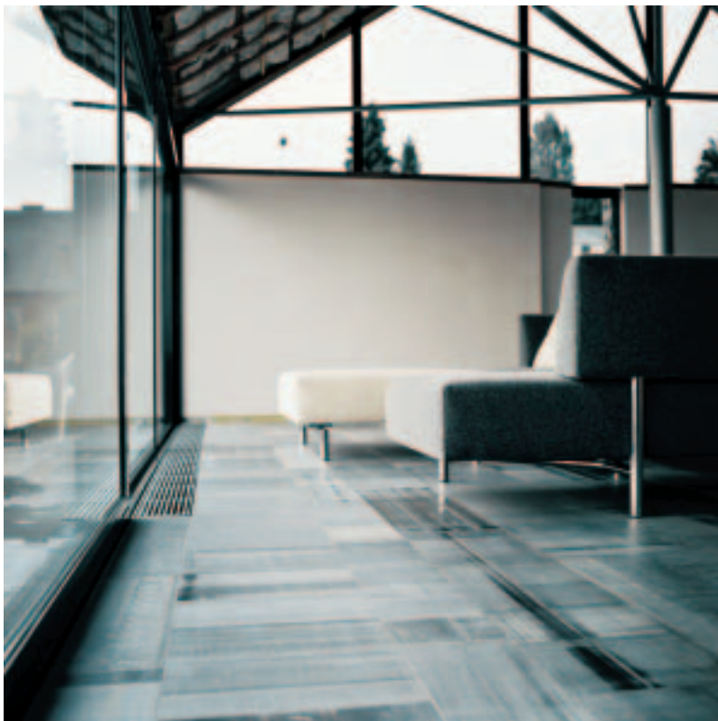
Un bel exemple d'utilisation indoor outdoor de pierre naturelle belge.