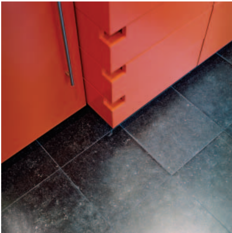
La modernité de la couleur et la beauté naturelle de la pierre se mettent ici mutuellement en valeur.

pour l'intérieur, y introduisant ainsi un nouvel ordre de grandeur. Spectaculaire! Le même fabricant se signale encore par la gamme Eco-Leader fabriquée avec 40% de matières recyclées et tout spécialement destinée aux constructions éco-durables.